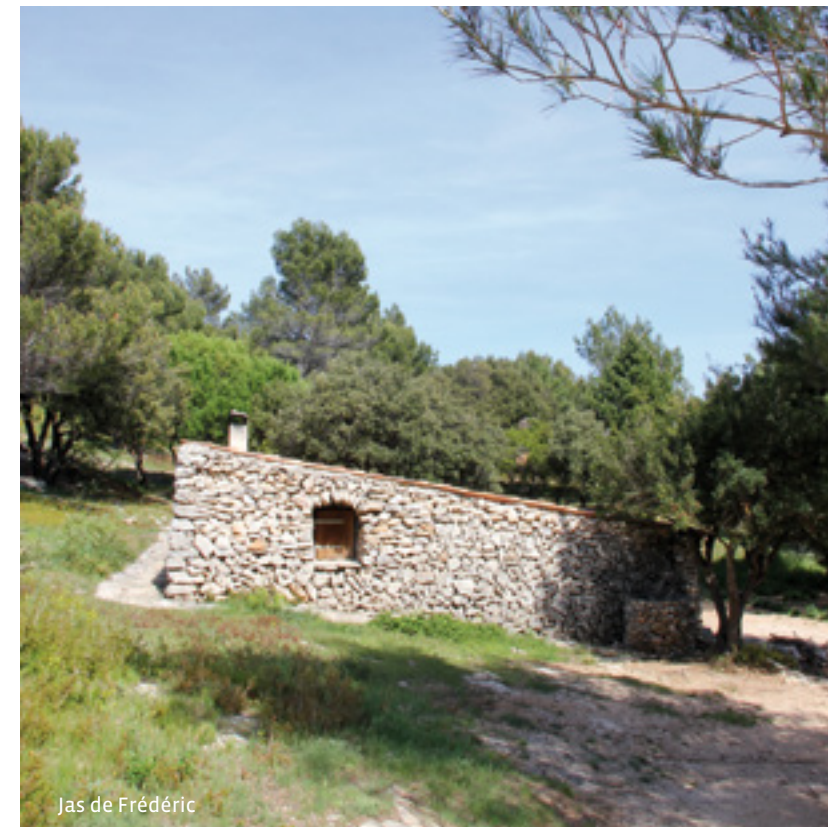
Jas de Frédéric

Les jas sont d'anciennes bergeries qui servaient d'abris aux bergers et à leurs troupeaux. Situés entre 500 et 600 m d'altitude sur le versant sud de la Sainte-Baume, ils permettaient d'éviter aux bêtes de longs trajets vers les pâturages. Les troupeaux d'ovins arrivaient du Var ou de la vallée de l'Huveaune avant de partir en transhumance vers les Alpes. Le Jas de Frédéric porte le nom d'un ancien propriétaire. Il a été reconstruit en 1997 par les compagnons bâtisseurs en respectant l'architecture d'origine.