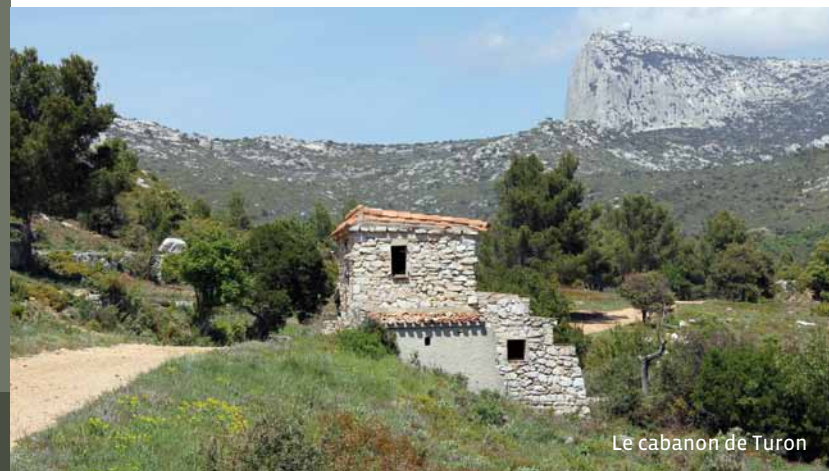
Le cabanon de Turon

Vue sur la face nord et sud de la Ste Baume et vue sur la plaine de Cuges et son polje, l'un des plus grands de France. Un polje est une dépression karstique.